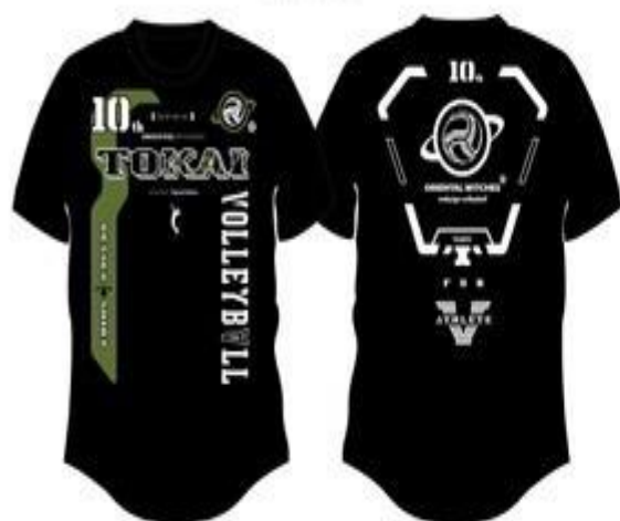
ブラック (カーキ・ホワイト)