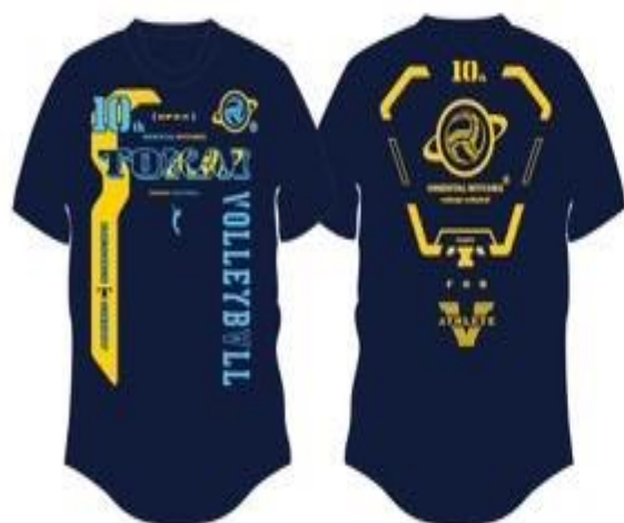
ネイビー (サックス・サンイエロー)