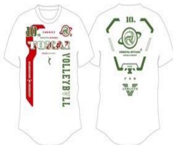
ホワイト (ディープレット・カーキ)